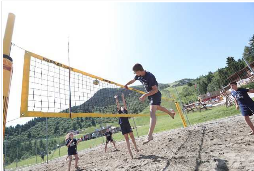
durante l'edizione 2019.

Un'ottantina di giovani pallavolisti per la prima settimana di attività